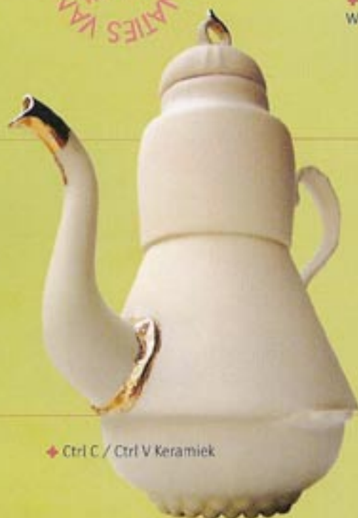
➤ Ctrl C / Ctrl V Keramiek