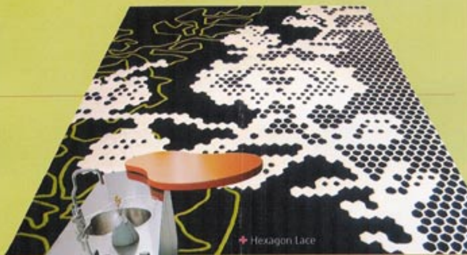
➤ Hexagon Lace